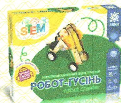
Електромеханічний конструктор Робот-гусінь арт.138738