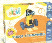
Електромеханічний конструктор Робот-стрибунець, арт.135742