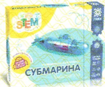
Розвиваючий конструктор Субмарина, арт.135744