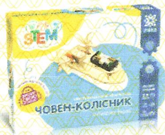
Електромеханічний конструктор Човен-колісник, арт.135739