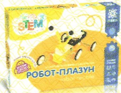
Електромеханічний конструктор Робот-плазун, арт.135740