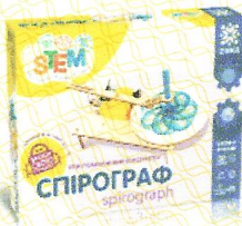
Електромеханічний конструктор Спірограф, арт.135741