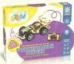
Електромеханічний конструктор Радіокерований гонщик, арт.135743

4. Опис об'єкта декларації (ідентифікація іграшки, яка забезпечує її простежуваність), включаючи кольорове зображення достатньої чіткості для ідентифікації іграшки.