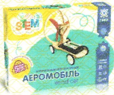
Електромеханічний конструктор Аеромобіль, арт.135745