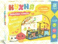
Кімната с меблями Кухня Дерев'яний 3Д конструктор, арт.131912